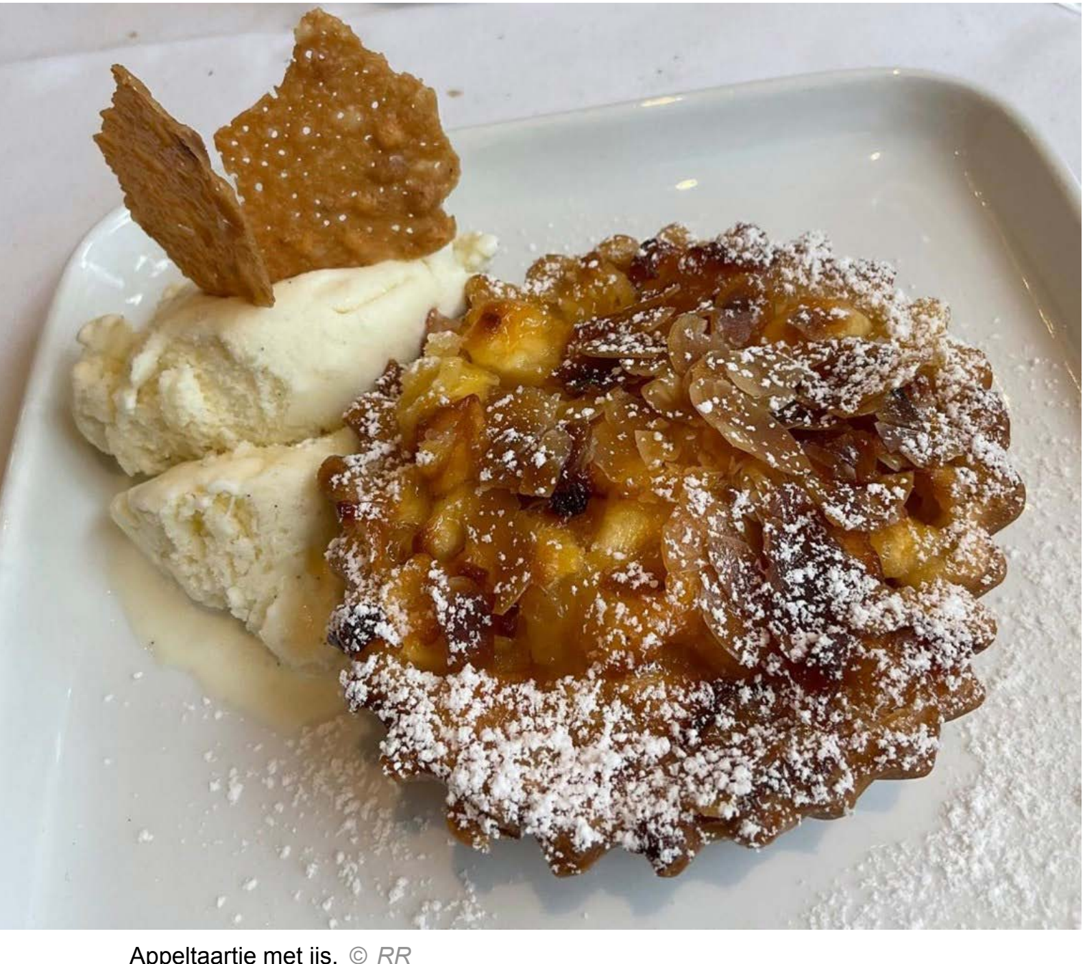
Appeltaartje met ijs.

Op de website lees ik dat een bezoek moet voelen alsof je in Italië bent. Daar zijn ze goed in geslaagd. Als ze op de achtergrond dan nog wat Italiaans staan te kwetteren, is vakantie niet veraf. Die komt nog wat dichterbij met het dessert, een appeltaartje met ijs (7,50 euro). Een mooie combinatie van koud en warm, appel en amandel gelift met een snuffje kaneel, twee lichtzoete krokantjes een beetje bloemsuiker zoals de nonna dat zou doen. En dan had ik het zanddeegje onderin nog niet geproefd. Ik heb een reisdoel.